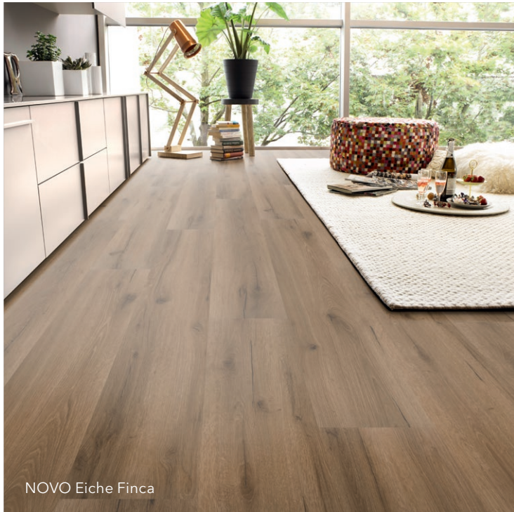
NOVO Eiche Finca