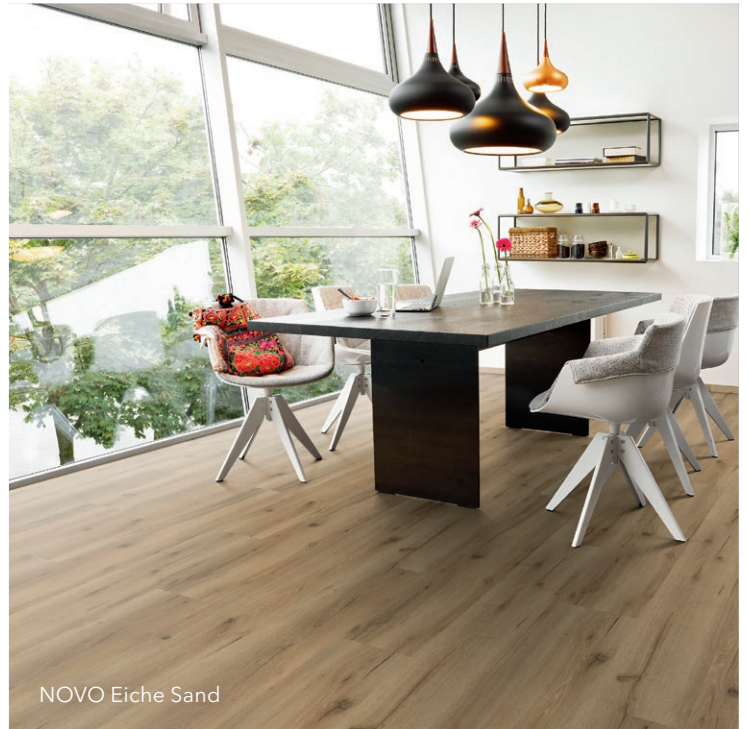
NOVO Eiche Sand