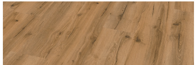
NOVO Eiche Kalahari | 10 00017 01