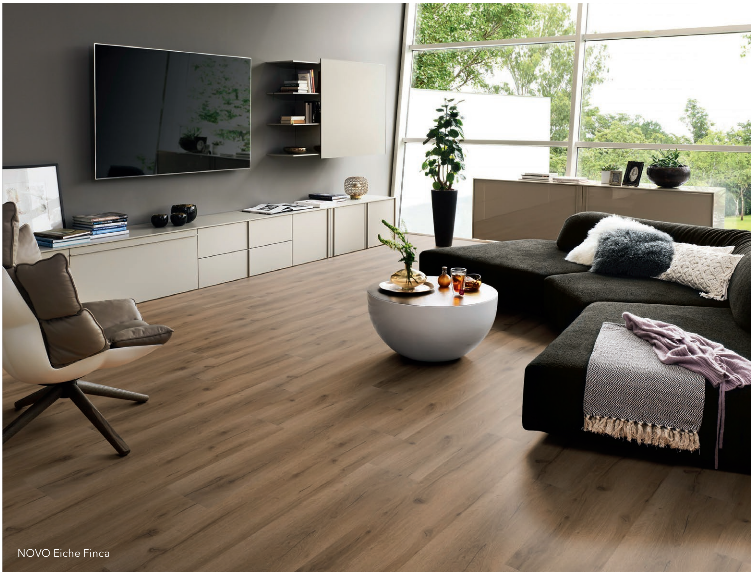
NOVO Eiche Finca