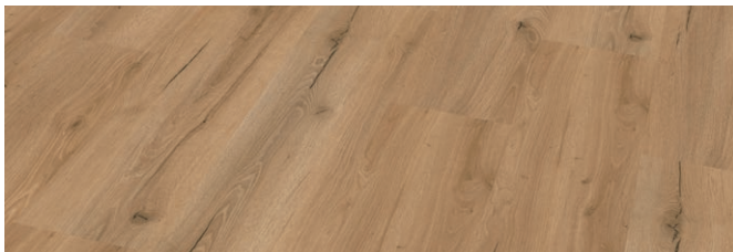
NOVO Eiche Macadamia | 10 00016 01

Softsynchrone Böden in unserer NOVO Kollektion, die jetzt schon zu den Bestsellern zählen: