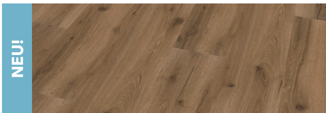
NOVO Eiche Finca | 10 00019 01

Softsynchrone Haptik, authentisch natürliche Optik.