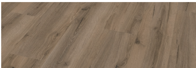
NOVO Eiche Victoria | 10 00023 01