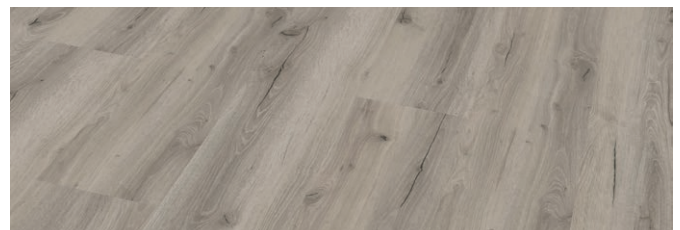
NOVO Eiche Dolomit | 10 00024 01