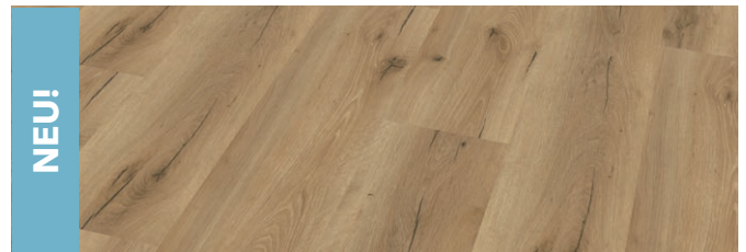
NOVO Eiche Sand | 10 00015 01

Softsynchrone Böden in unserer NOVO Kollektion, die jetzt schon zu den Bestsellern zählen: